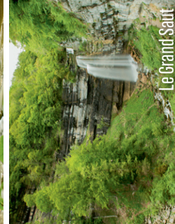
Le Grand Saut