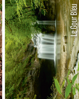
Le Gour Bleu