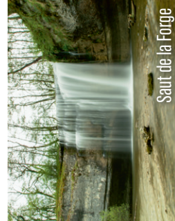
Saut de la Forge